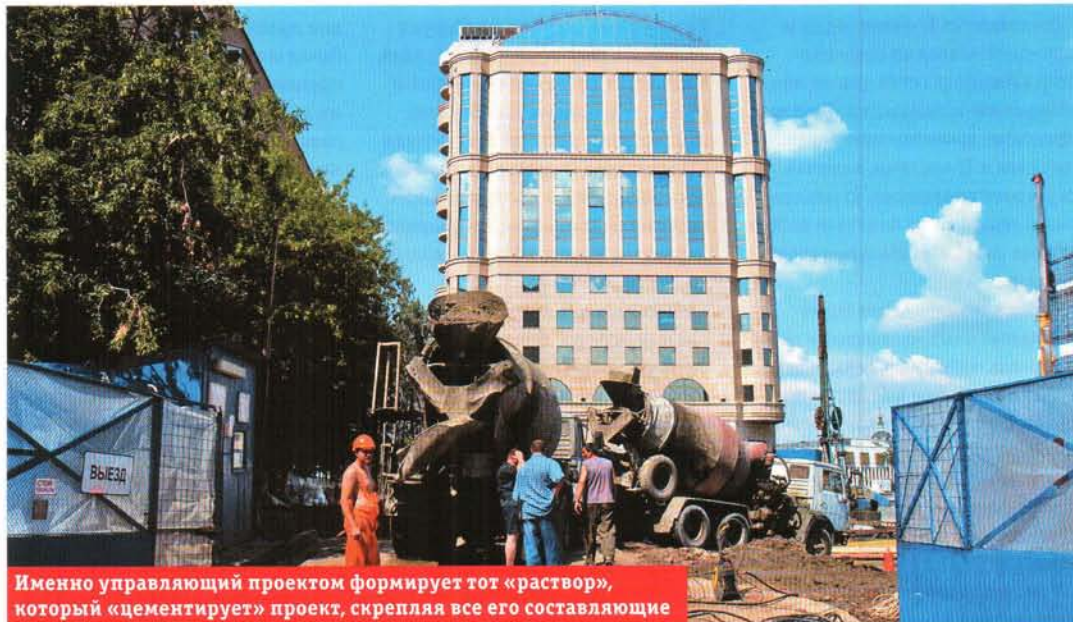
Именно управляющий проектом формирует тот «раствор», который «цементирует» проект, скрепляя все его составляющие

раньше имел дело с требовательными клиентами. Это должно быть для вас сигналом.